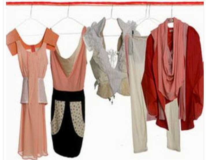
FASHION FÜR BLUT