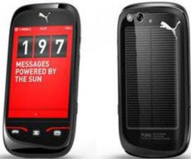
MIT SOLARSTROM ZU GÜNSTIGER SPORTBEKLEIDUNG