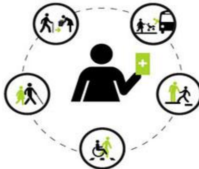
BÜRGERKARTE ZEICHNET BESONDERE VERDIENSTE AUS